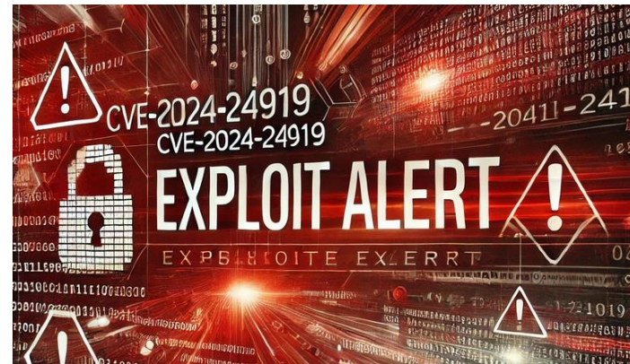
Exploração CVE-2024-24919 da Check Point: aviso urgente de patch do gateway de segurança