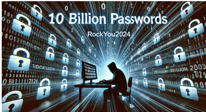
10 bilhões de senhas aparecem no lançamento do 'RockYou2024' da Dark Web