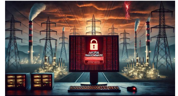
Akira Ransomware atinge o setor de energia brasileiro: Vazamento de Dados de 123 GB