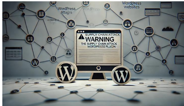
Ataque à cadeia de suprimentos do plugin WordPress compromete 36.000 sites