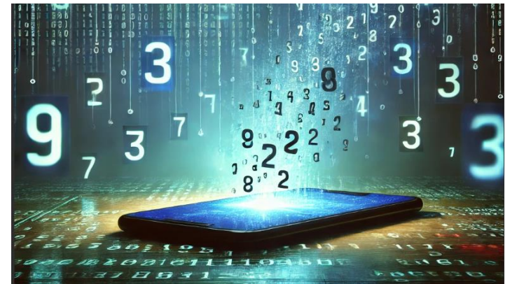
Hackers roubam números de telefone de 33 milhões de usuários do Authy