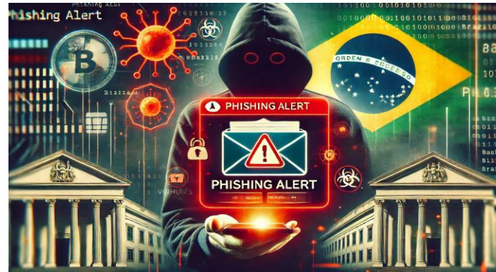
Malware CarnavalHeist atinge bancos brasileiros por meio de e-mails de phishing